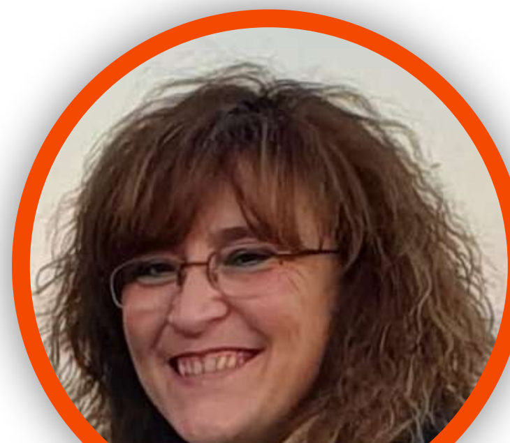
MARIANGELA MAPELLI SCUOLA PRIMARIA